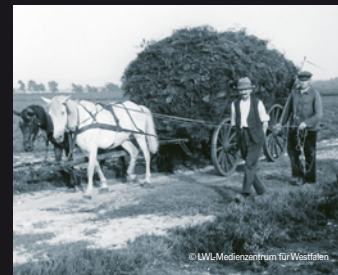
Der Abtransport der Plaggen in die Ställe erfolgte mit dem Pferdefuhrwerk (Senne, Ostwestfalen)