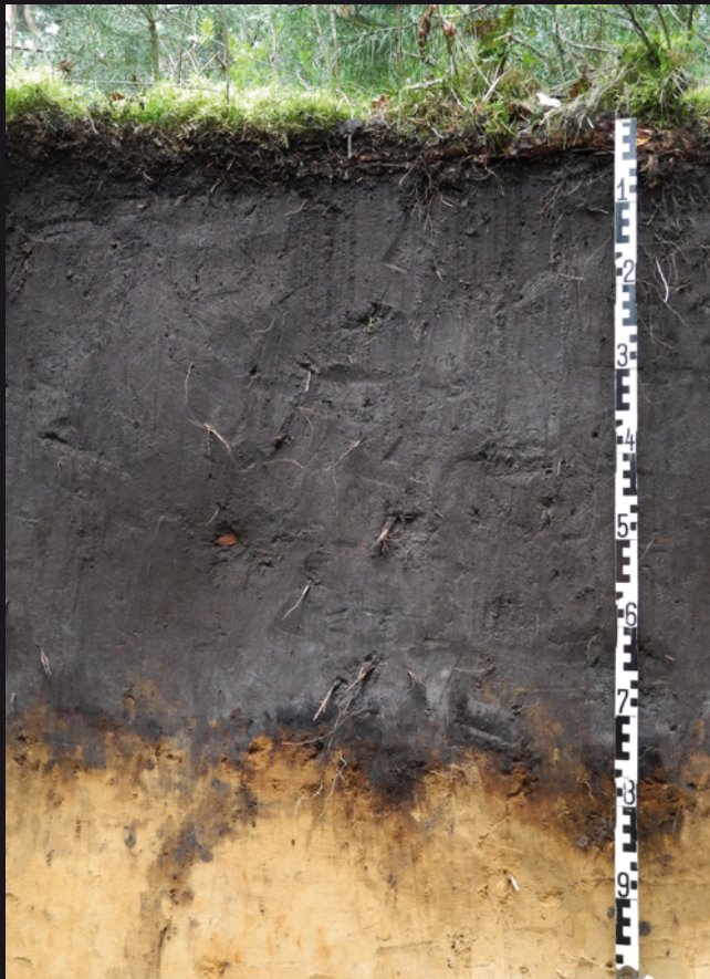
Schwarzgrauer Plaggenesch aus Heide-Plaggen bei Ostbevern (Münsterland)

Plaggenesche sind im nordwestdeutschen Flachland weit verbreitet. Sie entstanden durch die Tätigkeit des Menschen. Auf ortsfernen Flächen wurden Oberbodenstücke mit Teilen der Pflanzendecke, sog. Plaggen, abgestochen und als Einstreu in die Ställe gebracht. Das mit dem Dung der Tiere und Küchenabfällen vermischte Plaggenmaterial fuhr man dann zur Bodenverbesserung auf ortsnah Äcker. Durch diesen Materialauftrag wuchsen die Ackerflächen über Jahrhunderte langsam in die Höhe, es entstanden die Plaggenesche. Heute sind diese Böden Zeugnisse einer nicht mehr existierenden Landnutzungsform und daher besonders schutzwürdig.