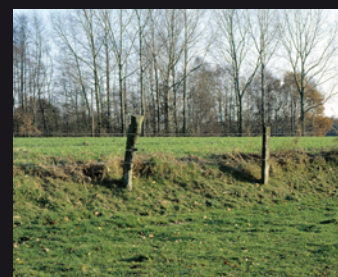
Durch den Plaggenauftrag sind Plaggenesche gegenüber ihrer Umgebung erhöht (Eschkante)