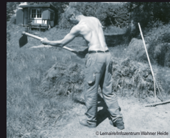
Mit der Plaggenhacke wurden Stücke des Oberbodens mit Teilen der Pflanzendecke gewonnen