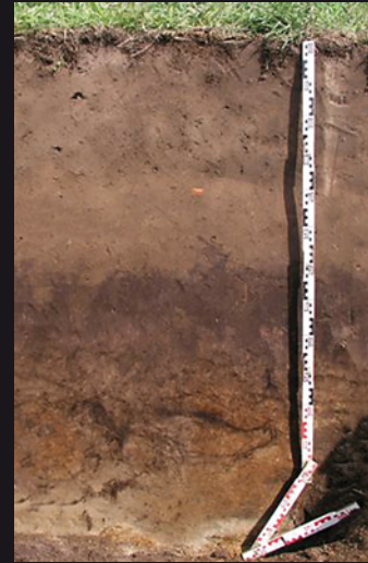
Brauner Plaggenesch aus Gras-Plaggen bei Willlich (Niederrhein)