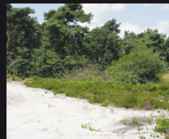
Die Plaggenentnahme-Flächen verarmten und verheideten, der Sand wurde vom Wind erodiert